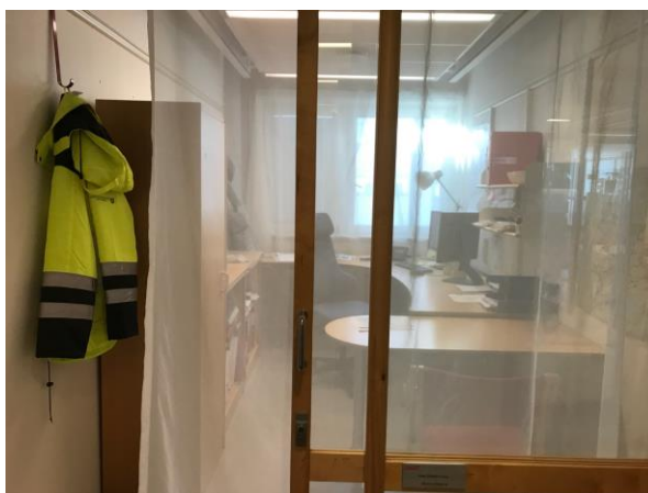
Skjermende gardiner foran vindu og dør mot korridor

Men etter mange møter, verneombud og bedriftshelsetjenesten litt på tilbudssiden, ble det vedtatt at jeg skulle få skjermet kontor i et friskt innemiljø. Det forelå også en uttalelse fra lege ved en sykehusavdeling for arbeidsmiljø om at det kunne vise seg å være hensiktsmessig at jeg fikk et skjermet kontor. Legen hadde selv sett mine reaksjoner på bruk av telefon med 4G: Hånden ble umiddelbart blå og iskald ved bruk, og jeg hadde beskrevet smertene som oppstår. At dette skjer, har jeg også fått dokumentert på video.