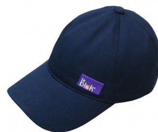
Strålebeskyttende Cap (Marineblå)