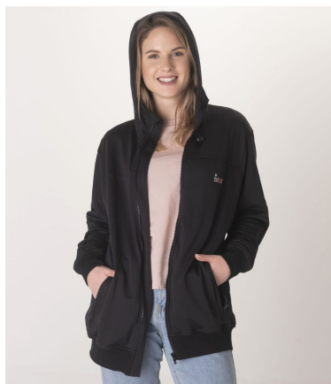
Skjermende jakke med hette, Unisex (Svart)