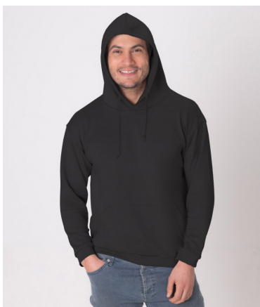
Skjermende hettegenser, Herre (Svart)