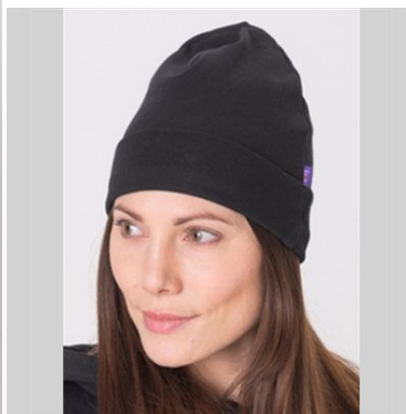
Strålebeskyttende Beanie (Svart)