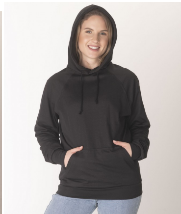
Skjermende hettegenser, Dame (Svart)