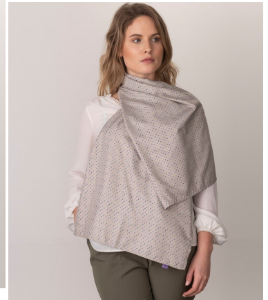
Strålebeskyttende skjerf (Polkadot) L