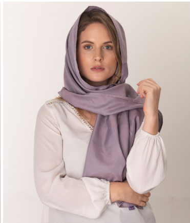
Strålebeskyttende skjerf (Lilla)