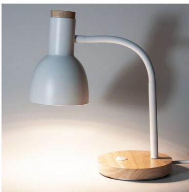
Bordlampe Berlin, fleksibel arm, trefot, 1,8m ledning, max 20W