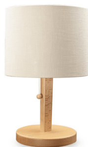
Bordlampe Bøk natur, 2m hvit ledning, E27, max 40W