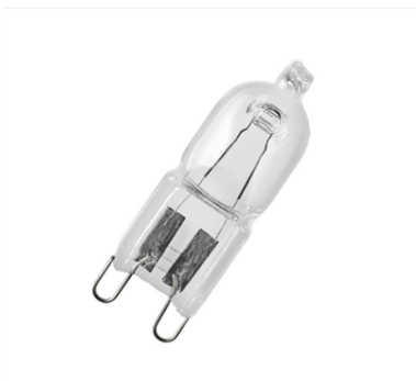
Osram halogen Eco G9, 60W, klar