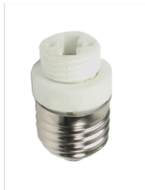
Adapter sokkel E27 til G9